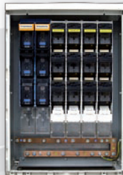
Energieverteiler 1.000 A